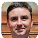
Laurent Grandguillaume, député et co-président du Conseil de la simplification